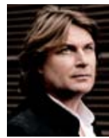
Klaus Florian Vogt (Tenor)

wurde 1942 in Milwaukee/Wisconsin, USA geboren und studierte in seiner Heimatstadt sowie in Chicago, Kopenhagen und London. 1963 wurde er ans Stuttgarter Ballett engagiert, wo er zum Solisten aufstieg. 1969 wechselte er als Ballettdirektor nach Frankfurt. Ab 1973 entwickelte er das Hamburg Ballett zu einer der führenden deutschen Ballettcompagnien. Bis heute gilt John Neumeiers Hauptinteresse dem abendfüllenden Ballett, sei es zu sinfonischer oder geistlicher Musik: Auf überzeugende Weise versteht er es, die klassische Ballett-Tradition fortzuführen und sie um zeitgenössische Ausdrucksformen zu bereichern. Seine neuesten Kreationen für das Hamburg Ballett sind Duse (2015) und Turangalila (2016). John Neumeier wurde international mit höchsten Auszeichnungen für sein Lebenswerk geehrt: in Deutschland mit dem Bundesverdienstkreuz, in Frankreich mit der Ernennung zum Ritter der Ehrenlegion und in Japan mit dem Kyoto-Preis.