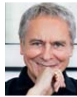
John Neumeier (Choreografie u.a.)

Zum jetzigen Zeitpunkt habe ich erst damit begonnen, die so genannte „Hamburger Fassung“ von Das Lied von der Erde zu erarbeiten. Wie immer, wenn ein Ballett von mir „nach Hause“ kommt, gewinnt es an Tiefe durch die Arbeit mit meinen eigenen Tänzern. Ich freue mich außerordentlich, für dieses Ballett sozusagen eine zweite Chance zu haben und daran noch einmal zu arbeiten: mit den Erfahrungen aus der ursprünglichen Kreation, mit der neu gewonnenen Distanz – und nicht zuletzt mit meiner Lebenserfahrung.