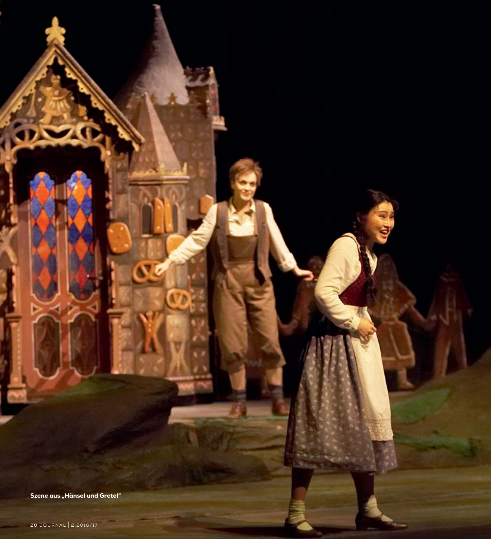
Szene aus „Hänsel und Gretel“