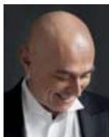
Paolo Carignani (Musikalische Leitung)

war von 1999 bis 2008 GMD der Oper Frankfurt und Künstlerischer Leiter der Konzerte des Frankfurter Museumsorchesters. Der Italiener hat an zahlreichen Opernhäusern seines Heimatlandes dirigiert sowie u. a. an der Wiener Staatsoper, an der Metropolitan Opera in New York, an der San Francisco Opera, an der Bayerischen Staatsoper, am Concertgebouw Amsterdam, am Opernhaus Zürich, am ROH Covent Garden in London, beim Glyndebourne Festival, an der Staatsoper und der Deutschen Oper Berlin, in Paris, dem Gran Teatre del Liceu in Barcelona, beim Rossini Opera Festival in Pesaro, beim Spoleto Festival und bei den Salzburger Festspielen. An der Hamburgischen Staatsoper dirigierte er 2008 Wagners Parsifal .