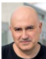
Calixto Bieito (Regie)

war von 1999 bis 2008 GMD der Oper Frankfurt und Künstlerischer Leiter der Konzerte des Frankfurter Museumsorchesters. Der Italiener hat an zahlreichen Opernhäusern seines Heimatlandes dirigiert sowie u. a. an der Wiener Staatsoper, an der Metropolitan Opera in New York, an der San Francisco Opera, an der Bayerischen Staatsoper, am Concertgebouw Amsterdam, am Opernhaus Zürich, am ROH Covent Garden in London, beim Glyndebourne Festival, an der Staatsoper und der Deutschen Oper Berlin, in Paris, dem Gran Teatre del Liceu in Barcelona, beim Rossini Opera Festival in Pesaro, beim Spoleto Festival und bei den Salzburger Festspielen. An der Hamburgischen Staatsoper dirigierte er 2008 Wagners Parsifal .