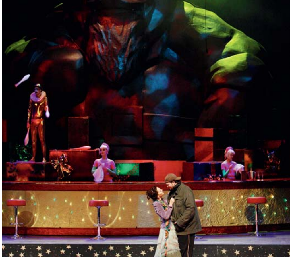
Szene aus „La Bohème“

ich dann anfang, mich ernsthafte für Klassik zu interessieren, habe ich mir alles angehört: Das gesamte Geigenrepertoire, viel Opernrepertoire. Ich besaß einen Bibliotheksausweis und habe mir viele Klassikaufnahmen ausgeliehen. Es öffnete sich eine ganz neue Welt für mich. Franz Schubert, zum Beispiel, hat mich immer sehr berührt, und ich habe viele Lieder von ihm gehört. Der erste Interpret, der mich begeisterte, war Dietrich Fischer-Dieskau. Er war der erste Lied- und Opernsänger, dessen Name mir im Gedächtnis haften geblieben ist, obwohl ich natürlich auch Aufnahmen mit Pavarotti oder Domingo kannte. In der Türkei habe ich das Fachgymnasium für Tourismus besucht. Das bedeutete automatisch, dass ich im Sommer in einem Reisebüro arbeiten musste. Und während ich dort meine Zeit verbrachte, habe ich nebenher viel komponiert und Lieder geschrieben. Damals wurde mir klar, Tourismusmanagement kann nicht meine Zukunft sein. Im Reisebüro wurde mir bewusst: Ich will auf die Bühne! Zunächst wollte ich lieber Dirigent werden und Komposition studieren, deswegen habe ich viel Geld für das Konservatorium ausgegeben. Einer der Lehrer meinte: „Wenn du schon so viel Geld aus gibst, kannst du auch gleich Gesangsstunden nehmen!“ Ich antwortete ihm: „Ja, gerne, das probiere ich mal.“ Dann holte ich mir eine CD aus der Bibliothek und lernte eine Arie Antiche. Nach dem Vorsingen bestätigte mir einer meiner