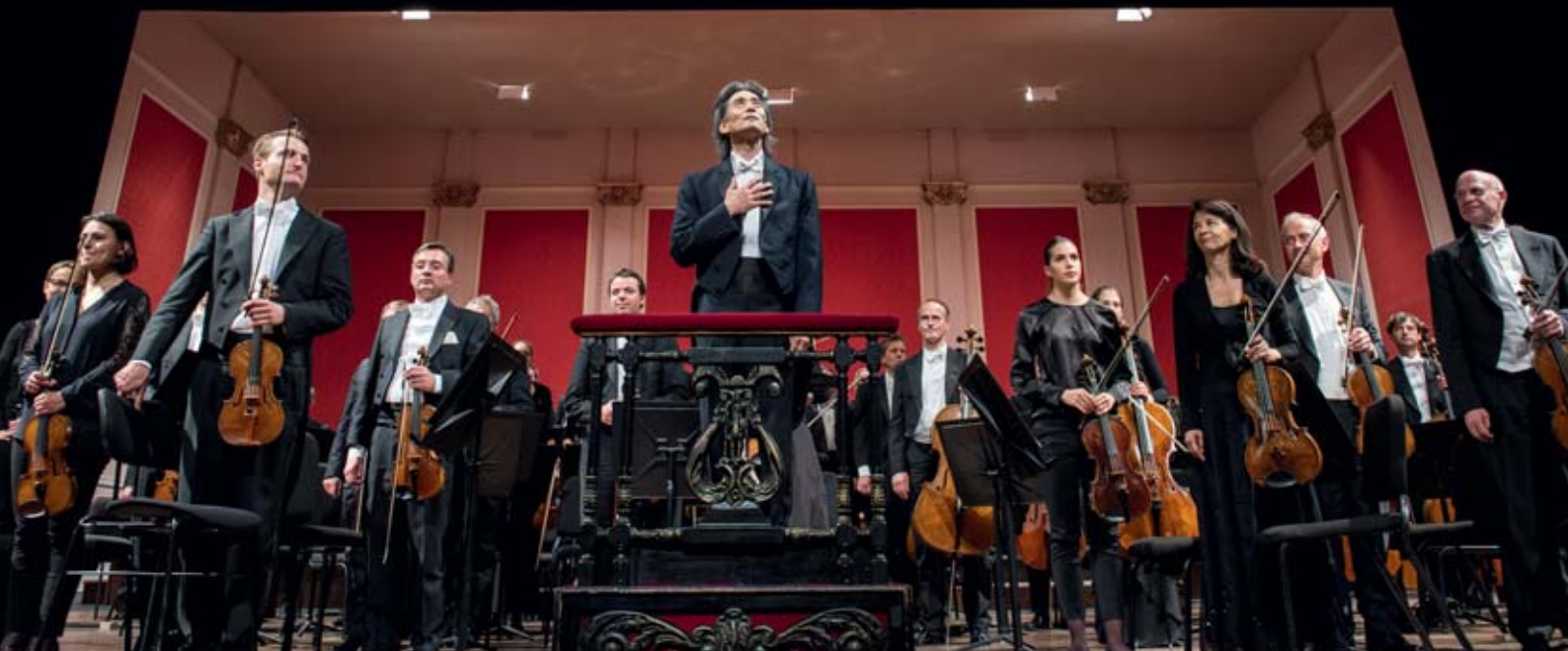
Kent Nagano und die Philharmoniker im legendären Teatro Colón

(Und so floss der Klang dieses Orchesters – was für ein Philharmonisches Staatsorchester Hamburg! – aus dem Graben wie die Lava aus einem Vulkankrater, zuweilen fühlte man eine gefährliche Hitze...“). Gemeinsam mit dem Philharmonischen Or-