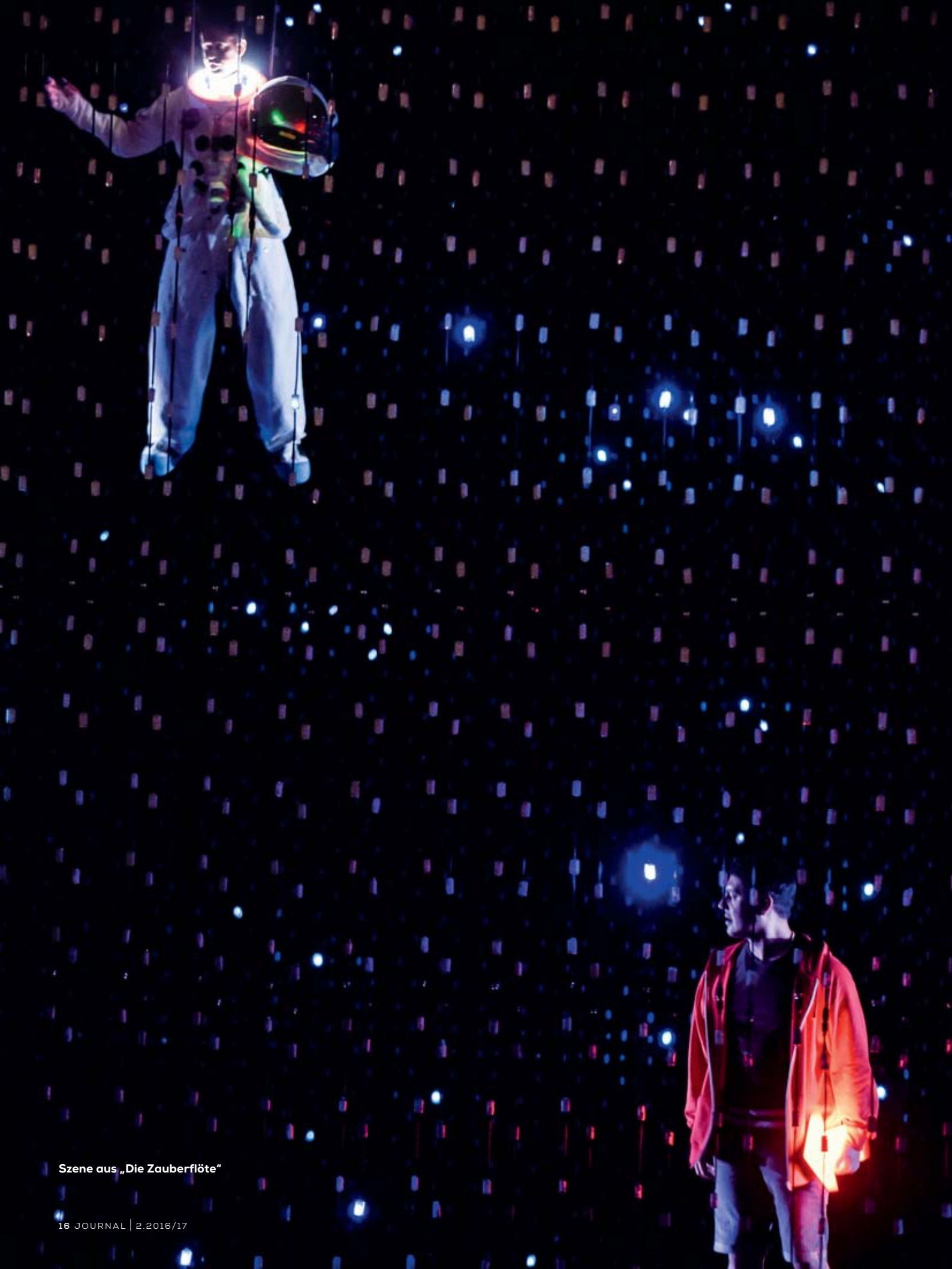
Szene aus „Die Zauberflöte“